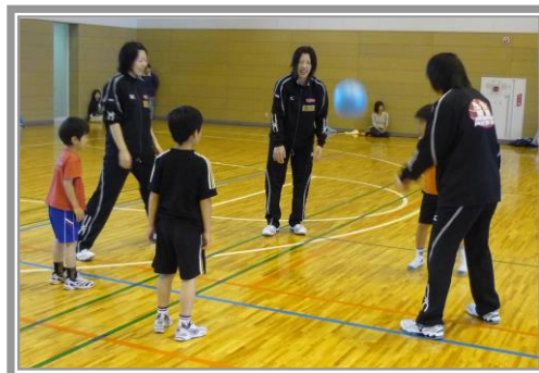
▲【ボールで遊ぼう！】栗山米菓バレー部 コーチ・選手とじゃんけんリレーや雑巾がけレース。そしてボールを使ってレシーブゲームなど、チーム対抗で競ったりもしました。最後には本物のバレーボールも使用して選手と2人組になってレシーブ・トス練習もしてもらいました。でもちょっと腕が痛かったかな？