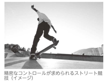
精密なコントロールが求められるストリート競技(イメージ)

スケートボードは、若い世代への発信力を高めるため、2020年の東京オリンピックで初採用されました。都市型スポーツとしての魅力や観戦性の高さが評価され、現在では夏季大会の正式競技として定着しています。